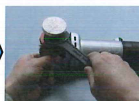
③専用研削刃を 取付けます