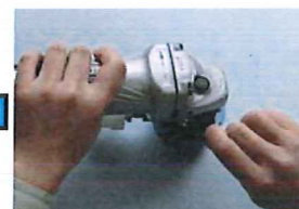
⑤ ボルトで固定します