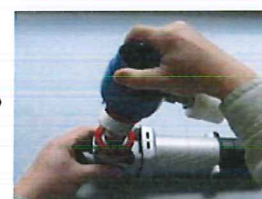
④カバー本体を はめこみます