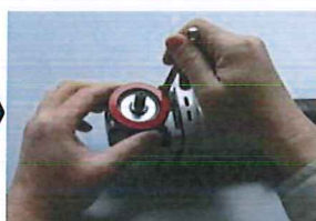
②カバー固定用 リングを取付けます