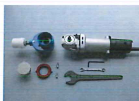
①装着パーツ、取付 工具を準備します

〈特長〉 ・ 切削箇所をカバーで覆うことにより、切削時の鉄粉飛散を防止します。 ・ 従来のディスクグラインダ（レジノイド砥石）による研削方法より簡単な操作で作業ができます。 ・ 周辺のボルト等を傷つける恐れがない為、長時間作業時の緊張感がなく、作業者の負担を軽減します。